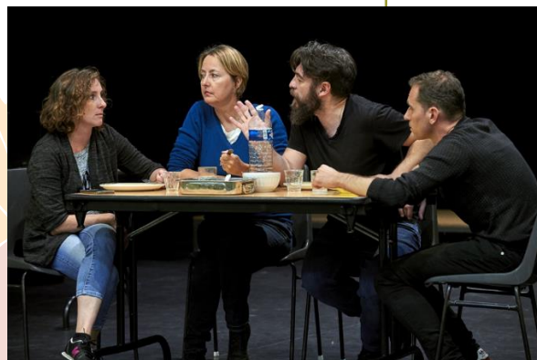
Flyer de l'association retraites CFDT et petits frères des pauvres-semaine bleue 2022

« Changer le regard sur la vieillesse pour mieux vivre, vieillir et partager » organisé par Petits frères des pauvres dans le cadre de la semaine bleue par la compagnie les désaxés du théâtre.