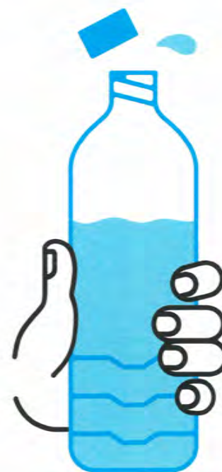
JE BOIS RÉGULIÈREMENT DE L'EAU