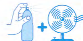
Je mouille mon corps et je me ventile