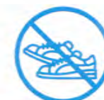
J'évite les efforts physiques