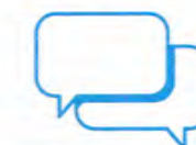
Je donne et je prends des nouvelles de mes proches

Si vous voyez quelqu'un victime d'un malaise, appelez le 15.