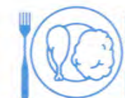
Je mange en quantité suffisante