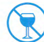
Je ne bois pas d'alcool